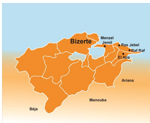
La zone de Ras Jebel, Raf Raf, El Alia et Menzel Jemil dans le gouvernorat de Bizerte

Zones géographiques : Le projet pilote se déroule dans quatre territoires à forte activité migratoire, identifiés de manière collégiale sur la base de critères sociodémographiques. Les autorités locales seront partie prenante du bon déroulement.