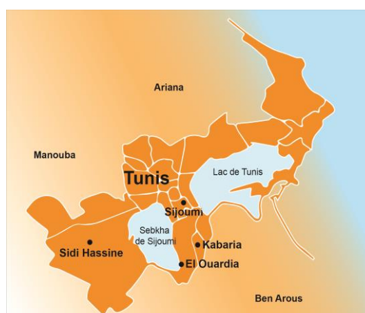
La zone de Kabaria, El Ouardia, Sidi Hassine et Sijoumi dans le gouvernorat de Tunis

Contact : +216 29 530 385 - kais.mnasri@ofii.fr